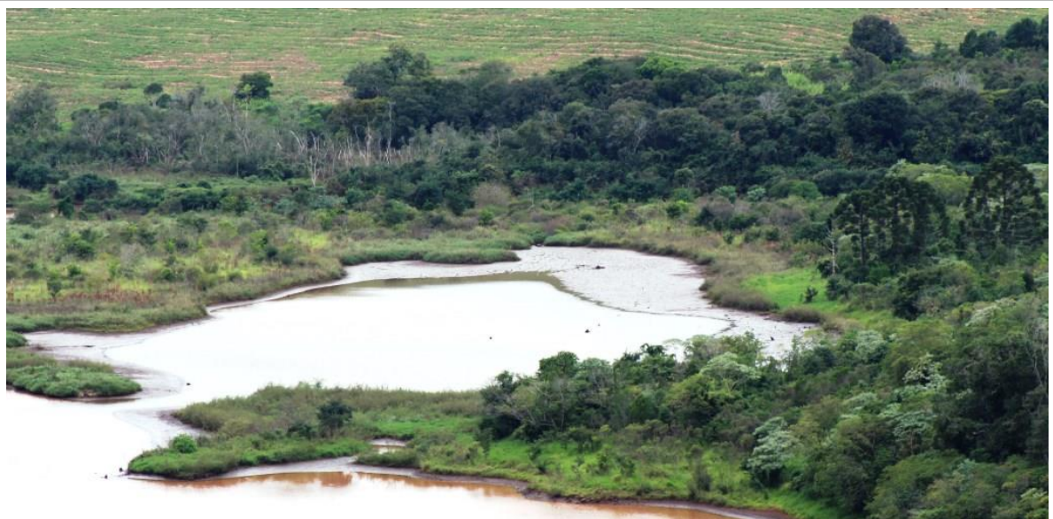
Figura 01: Plantios florestais da APP vêm se desenvolvendo com sucesso.

A área oferecida como compensação pela supressão florestal realizada para a edificação da Usina e seu reservatório, em atenção aos requisitos estabelecidos no art. 17º, da Lei Federal