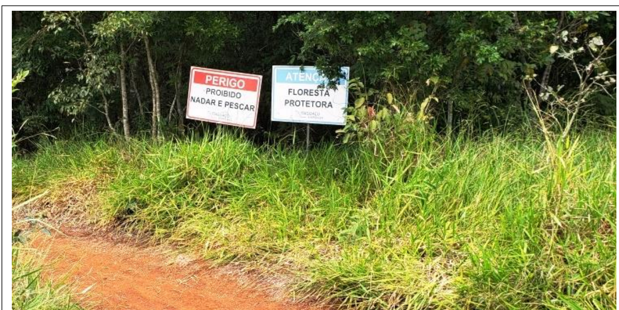
Figura 02: Além das cercas em todo contorno da APP, placas informam sua função protetora.