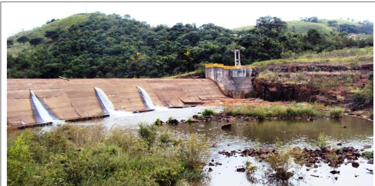
Figura 03: Vazão ecológica em três dutos, distribuindo o vertimento em barramento sobre os Saltos

O presente 5º Relatório Ambiental Anual corresponde ao cumprimento deste Condicionante.